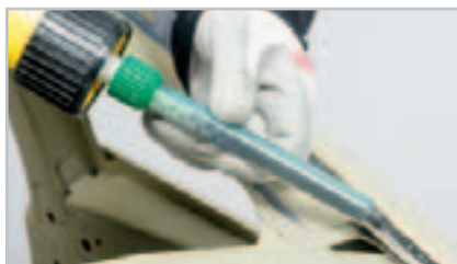
Легкость нанесения статическим смесителем