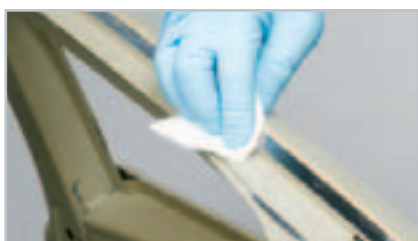
Быстрая и тщательная подготовка поверхности